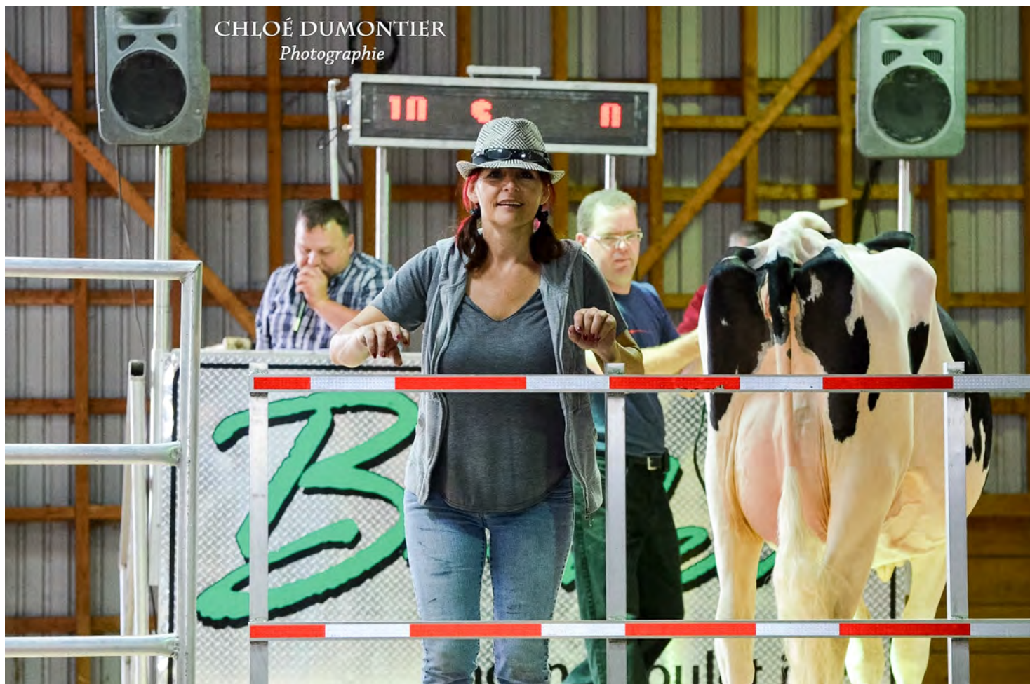
CHLOÉ DUMONTIER Photographie